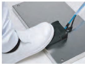
2 フットスイッチを踏みます。