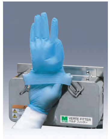
4 ダブル装着も簡単に出来ます。