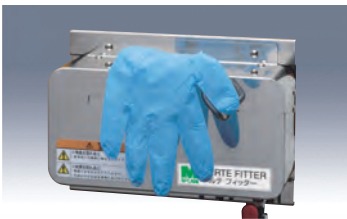
1 手袋をフックに引っかけます。