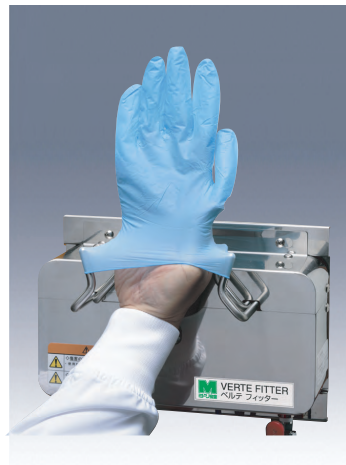
3 ふくらんだ手袋に手を入れ装着します。