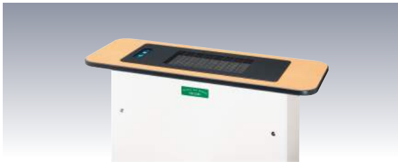
6018005400 木製天板 W900×D360×H20